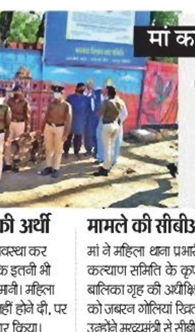
शमशान पर पहरा