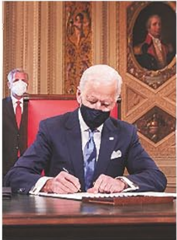
US President Joe Biden is expected to send a Bill to the Congress that proposes to do away with per country cap for employment-based green card

The Indian technology industry has welcomed the US President Joseph Biden for his stand on immigration and the H1B visa. Biden is expected to send a Bill to the Congress that proposes to eliminate the per country cap for employment-based green cards. All this is expected to help Indian IT professionals.