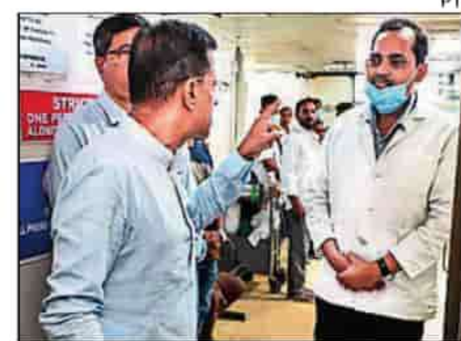
Health minister Vishwajit Rane with a doctor at GMC Saturday

In a viral video, Rane is seen telling the senior doctor to "shut up" and "go home". He asked the