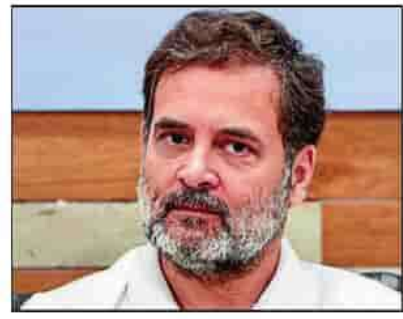
Rahul on Saturday hit out at EC after it rejected his allegations of 'match-fixing' during elections in an Op-Ed article

Rahul, leader of opposition in Lok Sabha, on Saturday hit out at EC after it rejected his allegations of "rigging" in Maharashtra elections in an Op-Ed. He had said the poll was a "blueprint for rigging